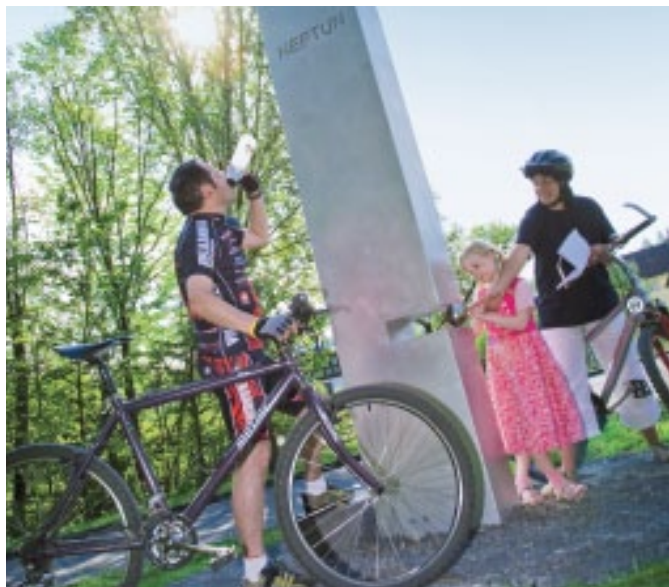
Neptun am Kosmosradweg Kleine Kyll