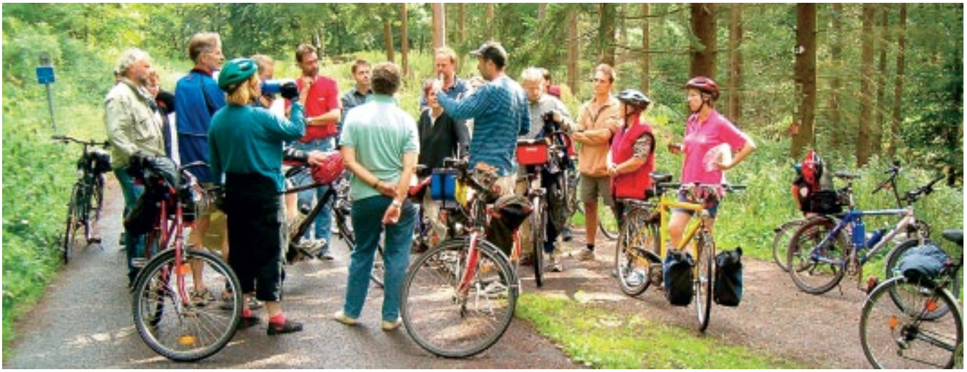
Informationen aus erster Hand