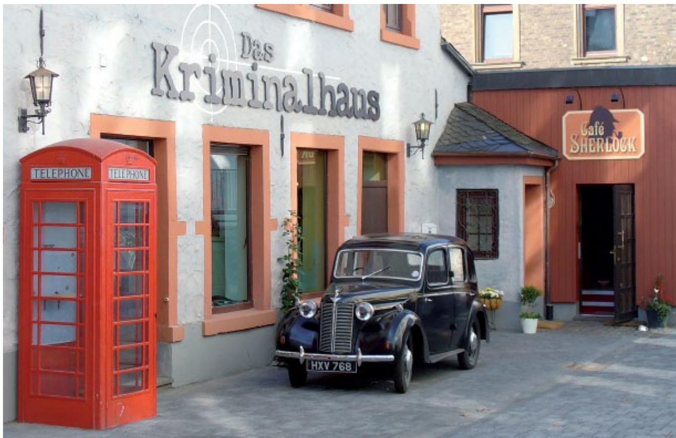
Das Kriminalhaus – Hillesheim