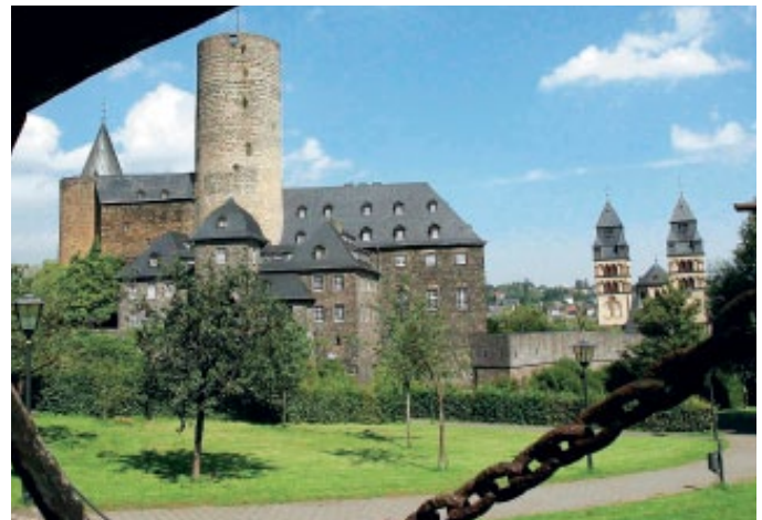
Genovevaburg – Mayen