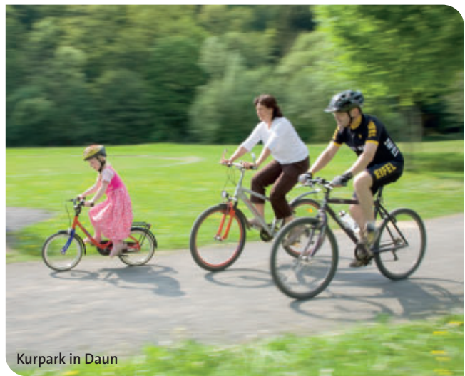
Kurpark in Daun