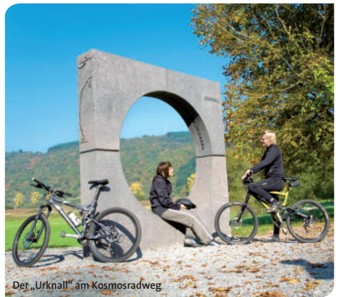
Der „Urknall“ am Kosmosradweg

Bus & Bahn/Transfer: RegioRadler Bernkastel-Kues - Wittlich - Daun (Reservierung empfohlen: www.regioradler.de ), Eifelquerbahn (Daun – Gerolstein, hier Anschluss an den Kylltalradweg)