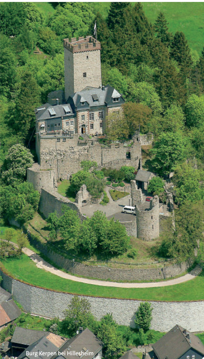
Burg Kerpen bei Hillesheim